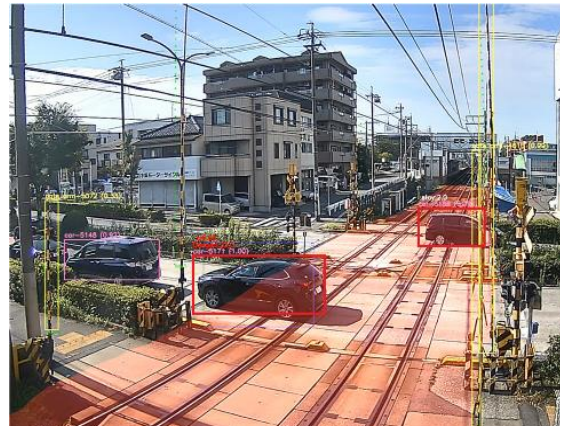
AI画像解析装置により物体を検知している様子（イメージ）

このような状況に対して、交通に関わる事業者が互いに協力し、AI画像解析を活用した事故を未然に防ぐシステムの構築を目指し、踏切の安全性を向上するための仕組みを導入します。